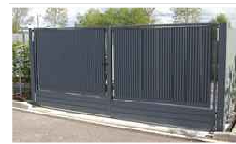
CANCELLO IN GRIGLIATO TIPO